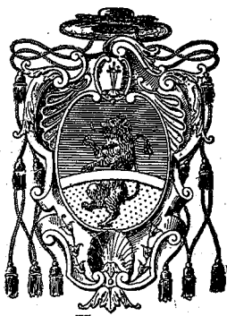
ARMES ÉPISCOPALES DE N. P. S. ALPHONSE