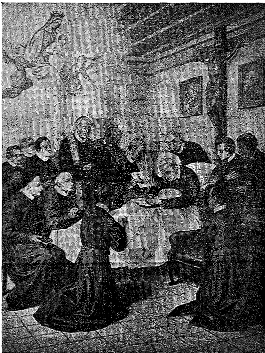
LA MORT DE SAINT ALPHONSE