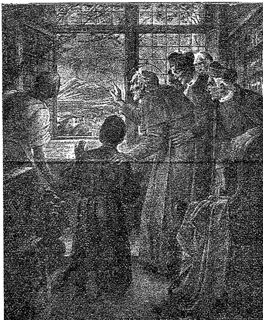
SAINT ALPHONSE BÉNIT LE VÉSUYE EN ÉRUPTION

Le 10 août de cette année, la communauté de Pagani fut témoin d'un prodige qui lui montra la puissance de Saint Alphonse sur le cœur de Dieu. Depuis quelque temps, le Vésuve, qui se dresse juste en face de Pagani, lançait des laves enflammées sur le territoire d'Ottoiano. Tous les environs étaient dans la consternation. Des fenêtres du corridor, les Pères contemplaient ce grandiose, maisterrifiant spectacle. Saisi d'horreur, un Père court à la cellule de saint Alphonse, et le conjure de venir voir ce qui allait se passer. Il vient en effet, s'approche de la fenêtre, en disant par trois fois : « Jésus ! Jésus ! Jésus ! » Il fit un grand signe de croix dans la direction de la montagne, et à l'instant même, l'immense tourbillon de feu et de flammes s'abîma dans le cratère. Telle était la puissance d'Alphonse sur le cœur de Dieu.