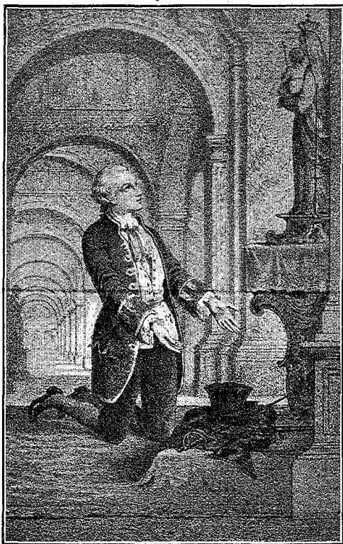
SAINTE ALPHONSE DÉPOSE SON ÉPÉE AUX PIEDS DE NOTRE-DAME DE LA MERCI