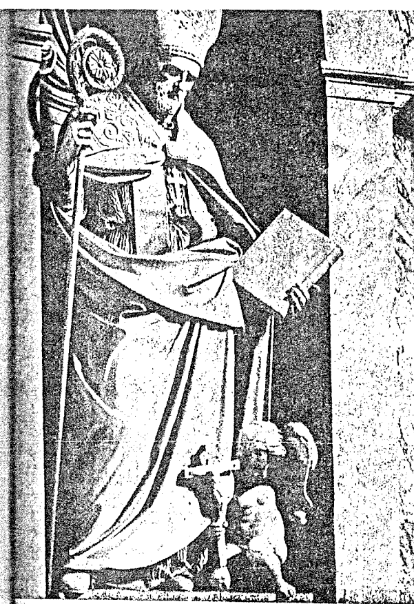
S. ALFONSO M. DEI LIGURI (TENERAN) - BASILICA VATICANA

SPEDIZIONE IN ABBONAMENTO POSTALE - GRUPPO III