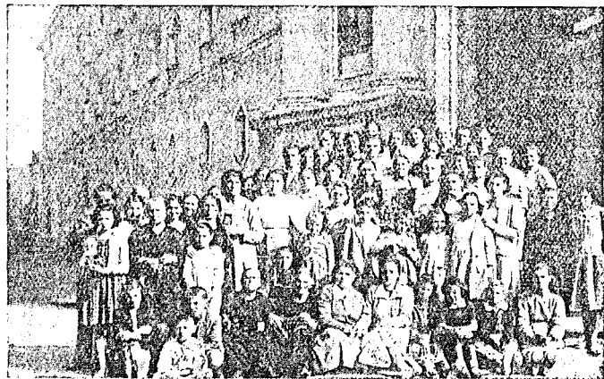
Pellegrinaggio di Grazzanise

Per tutta la Novena una breve istruzione e meditazione ai giovani e agli adulti, per i primi tre giorni una missioncina per i bambini, poi una « tre giorni » per la Gioventù femminile, e in fine una « tre giorni » per le Madri. Ciascun corso di predicazione si è concluso con una riuscita Comunione generale.