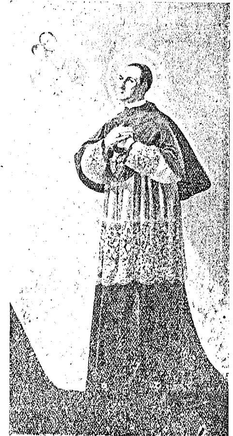
S. ANTONIO MARIA GIANELLI

Tutta la Chiesa ha esultato, ma in modo particolare i tre Istituti Religiosi che agli Eroi della Santità sono congiunti da speciali vincoli, come di famiglia. Le figlie di Maria SS. dell'Orto debbono a S. Antonio M. Gianelli la loro esistenza, l'ordine dei Barnabiti e quello dei Cappuccini hanno rispettivamente dato a S. Francesco Saverio Bianchi e a S. Ignazio di Laconi la forma della loro santità e hanno prestato l'ambiente spirituale, che ha agevolato le loro ascensioni nelle vie di Dio.