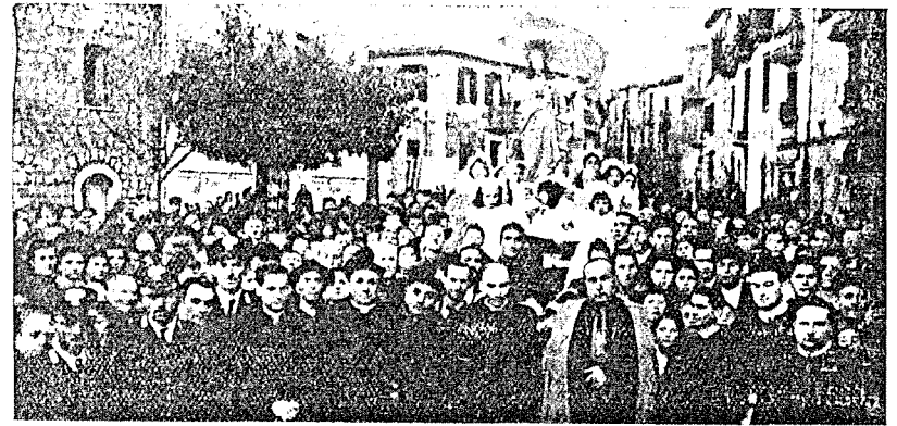
Castelvetero: il corteo antiblasfemo con la partecipazione di S. Ecc. Mons. Vescovo