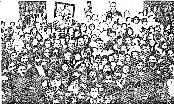
La consecrazione delle Madri e dei Bambini alla Madonna

urgenti lavori dei campi; di altre che han trascurato affari importanti; e son tanti gli altri che a fianco dei Missionari hanno girato casa per casa, invitando a frequentare la Chiesa, a comporre inimicizie, a venire ai Sacramen-