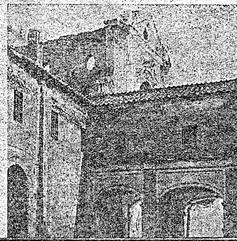
Il Chiostro, alcune celle, e la facciata della Chiesa.

Costruire un edificio che possa ospitare oltre cento giovani Studenti, il Collegio dei Professori e il personale di servizio; attrezzare quest'edificio perchè risponda pienamente alle esigenze moderne di un