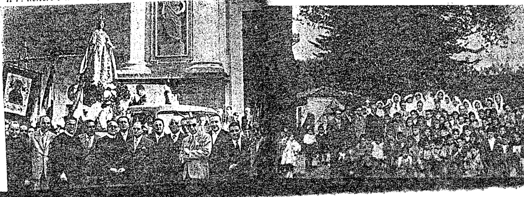
Il P. Rettore e il P. Porpora tra alcuni dei Professionisti che parlano. Un gruppo di bimbi, colle autorità, dopo la Comunità generale.

Si portò in processione la statua della Madonna del Rosario, venerata nella Basilica, la quale apparteneva a S. Alfonso, che la portava nelle missioni; insieme si abbinò la predicazione per le vie dei 15 Misteri del Rosario, affidandone il compito a 15 Professionisti della città. La statua fu deposta su un trono di garofani eretto sopra un automezzo: intorno alla statua una cerchia di Angioletti e figure simboliche. Molti dettagli rendevano pittoresco il quadro della folla: alte corone di rose raffiguranti i Misteri e i cinque continenti della terra erano