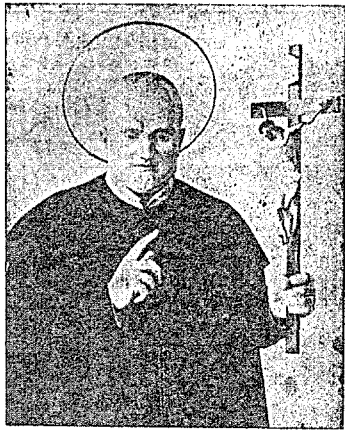
S. Clemente F. Hofbauer Redentorista

il doppio ideale dell'apostolo e del certosino.