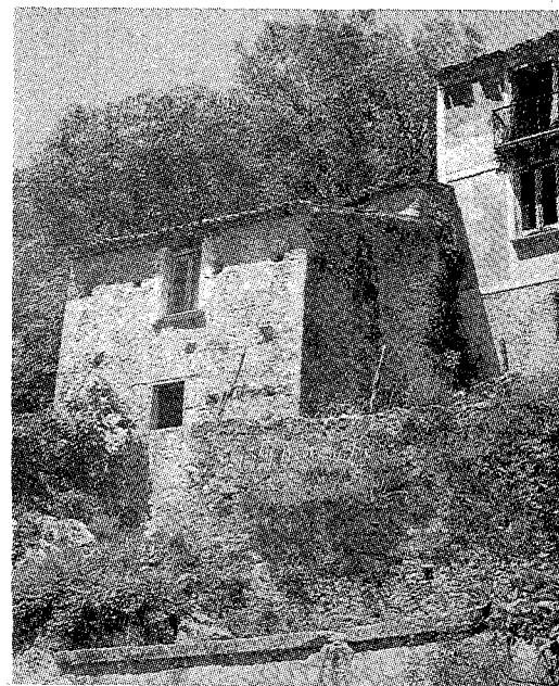
Casa Anastasio, prima abitazione dei redentoristi.

L'opzione per il povero è la eredità che ha trasmesso alla sua congregazione. Egli scrive: «Colui, che è chiamato alla congregazione del SS. Redentore, non sarà mai un vero continuatore di Gesù Cristo e non si farà mai santo, se non si riempie del fine della sua vocazione e non ha lo spirito dell'istituto, che è quello di salvare le anime più destituite di soccorsi spirituali, co-