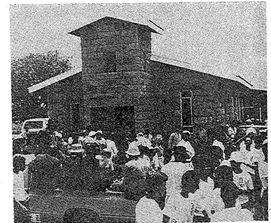
Africa del Sud: chiesa dedicata a S. Alfonso.