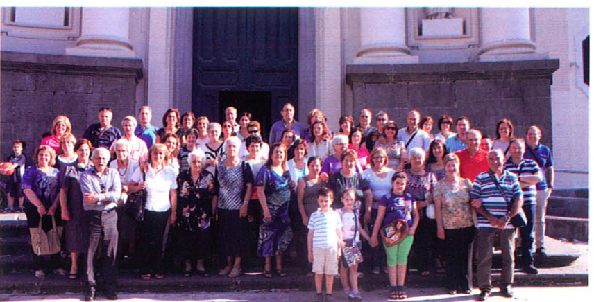
I gruppi di Azione cattolica di Gragnano, Castellammare di Stabia, Sorrento e S. Maria La Carità in pellegrinaggio a S. Alfonso.