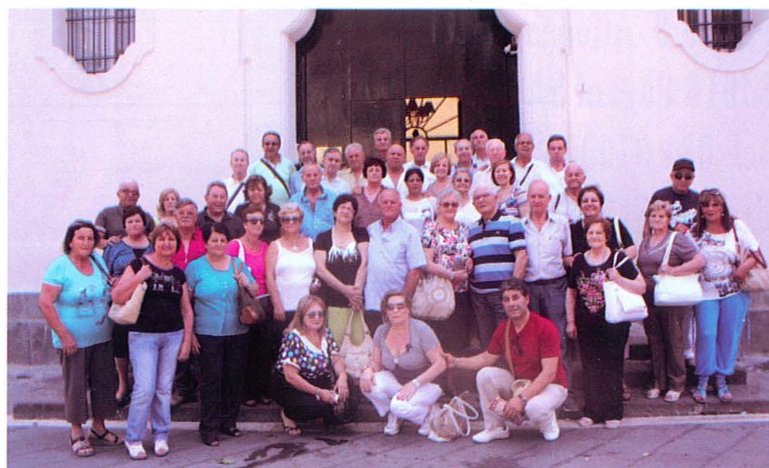
Fedeli di Piscinola (NA).