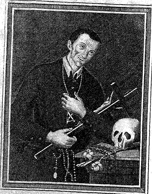
GERARDUS MAJELLA MURANUS

Laicus Congreg. S. Redemptoris, sanctitatis, miraculorum, donorumque supernaturalium fama clarissimus. Post vitæ annos fere 30. obiit idibus Octob. an. 1733.